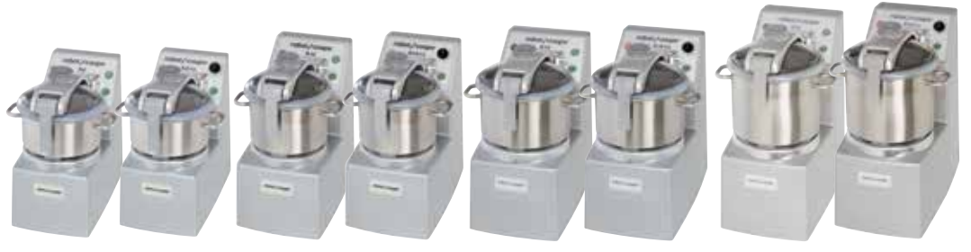
R 8 - R 8 V.V.