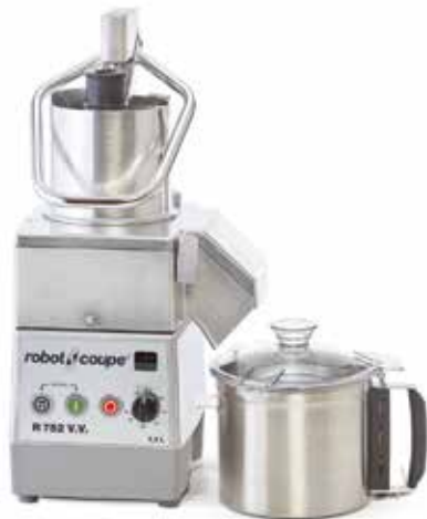
COMBINÉS À partir du R 502