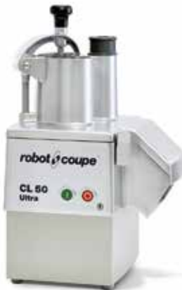
COUPE-LÉGUMES À partir du CL 50