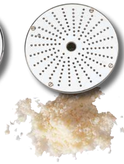
Finrivare för parmesan. Ref. 28061