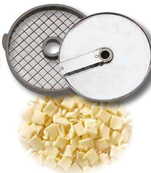
Tärningsutrustning 14x14x5 för mozzarella. Ref. 28181