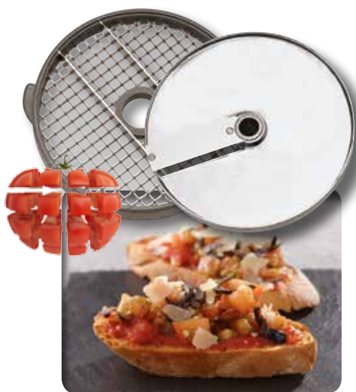
Tärningsutrustning 10x10 för tomat till bruschettan. Ref. 28112