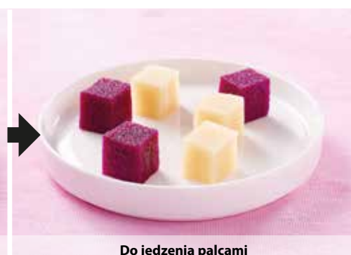
Do jedzenia palcami