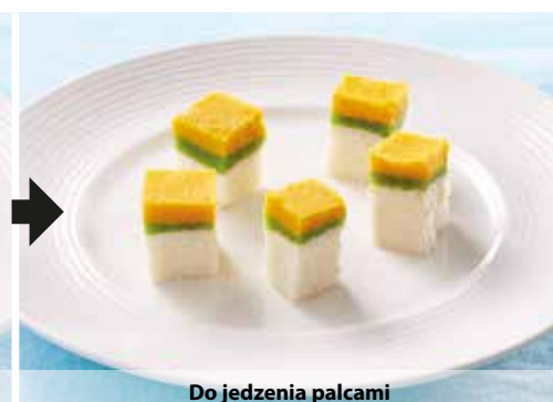
Do jedzenia palcami